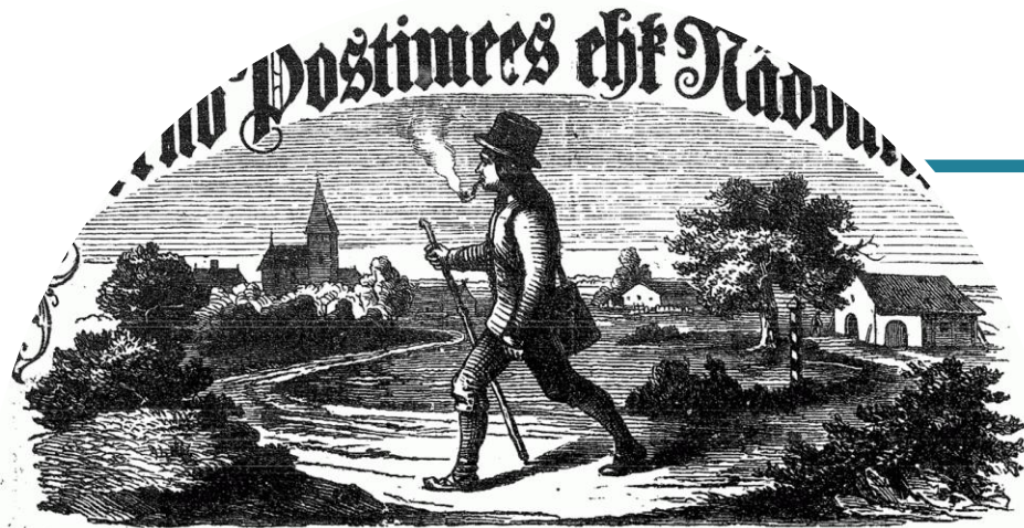
Vernus, kesknädal sel 19mal Jani-ku päeval.