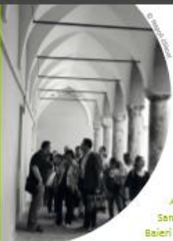
Kogedes alavat ajalugu paleograafia seminaril Napoli ülikoolis