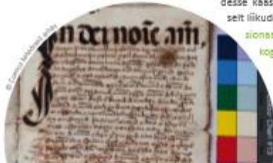
Hisseni asu Cuenca lätendat ilgpealeu kirjeldat arhiivat.

Uue põlvkonna kultuuriloo professionaalide väljõppes tasub toetuda arhiivides leiduvale teadmisele. Viies seda teadmist väljapoole arhiive ja vastupidi, tuues arhiividesse kaasajase teadustöö praktikaid, saab samaaegselt liikuda kahesuunalisel teel. Tiimitöö väljub professionaalide ringist ja hõlmab üha enam kasutajate kogukondi!