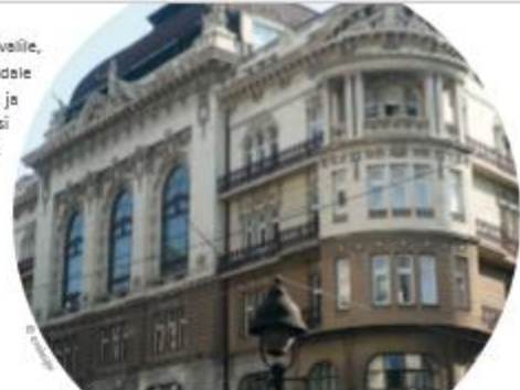
Arhiivad (sfr): Serbia Teaduste ja Kunstide Akadeemia Gallari korstbaat) oma mujatsatdavate fassaadide, ajaloo ja tšibajetega on midagi sellist, mille üle tasub imetada!

Lisaks kahele suurele kohtumisele ja lõpufestivalile, mis toob kõik projekti tegevused keskpõrandale kokku, korraldavad projekti partnerid rahvuslikke ja rahvusvahelisi ümarlaudu, õpitubasid ja koolitusi inspireerimaks ja ergutamaks teadmiste vahetust professionaalide ja avalikkuse vahel.